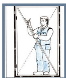
Bild 4: Ta två träribbor och mät diagonalerna åt båda håll i karmens hörn. De ska vara lika långa. Om måttet inte skulle stämma, lossa skruvarna och justera med kilarna.

Bild 3: Låssidan ska också vara i lod och inte luta inåt eller utåt. Skruva fast låssidan. Fäst den på samma sätt som gångjärnssidan.