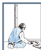
Bild 6: Kapa kilarna i nivå med karmen. Isolera mellanrummet mellan karm och vägg noga med vindtät isolering. Drevning ska anbringas invändigt och utvändigt. Drevna dock inte så hårt att karmen buktar. Den måste kunna andas, så att inte fukt stängs in. Komplettera med fogmassa på utsida för ljud- och fuktisolering.

Det görs kontinuerliga förbättringar på våra produkter. Vi förbehåller oss därför rätten till konstruktions- material och designförändringar. Polardörren försäkrar att tillverkningen av klassificerade dörrblad och karm som märkts med typgodkännandeskyld 2088/90 har tillverkats i enlighet med våra gällande Typgodkännandebevis och till beviset tillhörande handlingar.