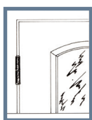
Bild 5: Häng på dörrbladet och kontrollera att springan mellan dörrblad och karm runt om är jämn. Mät noga för att undvika att karmen är skev i förhållande till dörrbladet. Kontrollera att dörren går lätt att öppna och stänga och finjustera karmen om det behövs. På så sätt förebygger du framtida problem. Om det skulle vara ett glapp vid slutblecket kan du justera detta genom att böja ut tungan i slutblecket. Hänger dörren för lågt, använd justerings-brickor som man sätter i gångjärnet på dörrdelen. Det finns också ställbar skruv i gångjärnet för justering i sidled.

Bild 4: Ta två träribbor och mät diagonalerna åt båda håll i karmens hörn. De ska vara lika långa. Om måttet inte skulle stämma, lossa skruvarna och justera med kilarna.