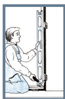
Bild 2: Kila karmen så att gångjärnssidan kommer i lod och kontrollera med långvattenpass. OBS! Kilning ska alltid finnas mellan slutbleck och vägg samt mellan gångjärn och vägg, dvs. tre kilpunkter på båda karmsidor. Karmen måste vara rak. Det är viktigt att du placerar kilarna parvis, inifrån och utifrån, så att karmen kommer att vara i lod både inåt och utåt.

Bild 1: Kontrollera först att underlaget för tröskel är i våg. Lyft in karmen och kontrollera att tröskeln är i vattring. Ställ karmen på klossar så att isoleringen ryms. Det är viktigt att tröskeln har stöd i hela sin bredd.