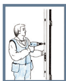
Bild 3: Låssidan ska också vara i lod och inte luta inåt eller utåt. Skruva fast låssidan. Fäst den på samma sätt som gångjärnssidan.

Se till att det även finns utrymme för tätning runt karmen. Skruva först gångjärnssidan med karmhylsa. Avståndet mellan karm och vägg avgör vilken längd på fästskruv som ska användas. Kravet på monteringsdjup i träregeln är minst 45 mm. Fortsätt att kila resten av karmen enligt ovan.