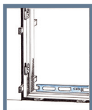
Bild 1: Kontrollera först att underlaget för tröskel är i våg. Lyft in karmen och kontrollera att tröskeln är i vattring. Ställ karmen på klossar så att isoleringen ryms. Det är viktigt att tröskeln har stöd i hela sin bredd.

Material SOM BEHÖVS VID MONTERING: KARMSKRUV (70-90 MM), KILAR, BRANDHÄRDIGT TÄTNINGSMATERIAL.